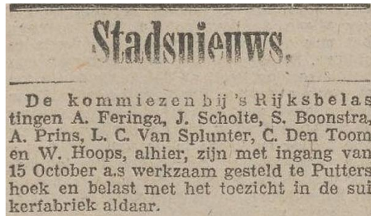
Rotterdamsch Nieuwsblad 15 oktober 1918

De douane had ook een rol bij de controle op de suikerproductie, waar belasting over moest worden betaald. Voor dit toezicht werden medewerkers gedurende de suikercampagne een paar maanden overgeplaatst naar de suikerfabrieken, waaronder die in Puttershoek en Oud-Beijerland.