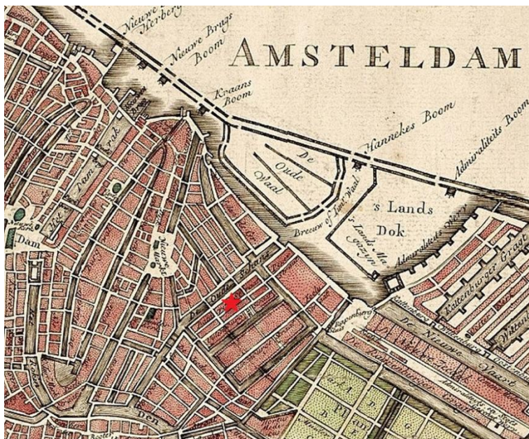
Een kaart van Amsterdam ca. 1770.

Poorter kon je worden wanneer je over voldoende middelen van bestaan beschikte. Je werd het ook wanneer je trouwde met iemand die al in de stad thuishoorde en poorter was. Bij Willem zou dit laatste het geval kunnen zijn. Een paar maanden voor zijn inschrijving was hij immers getrouwd met een dochter van een poorter.